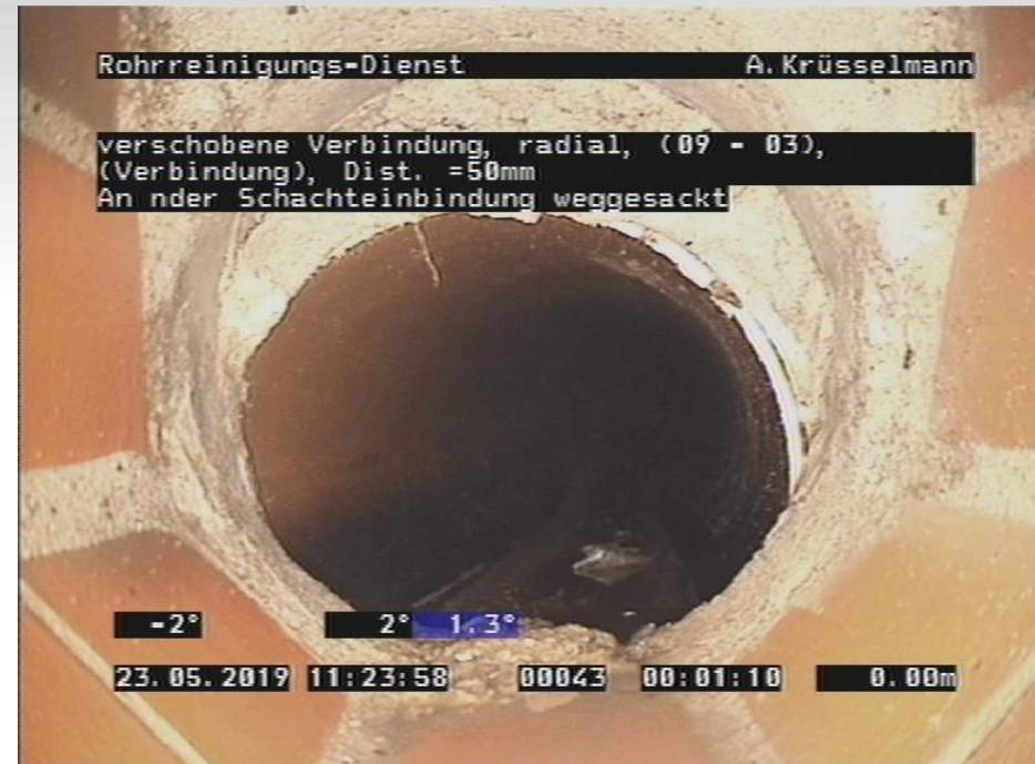
Weitere Schäden, z. B. verschobene Verbindungen