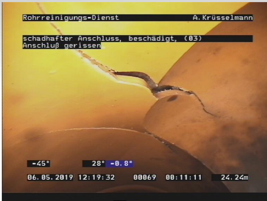
Typischer Schaden Riss/Bruch > 50 Stück