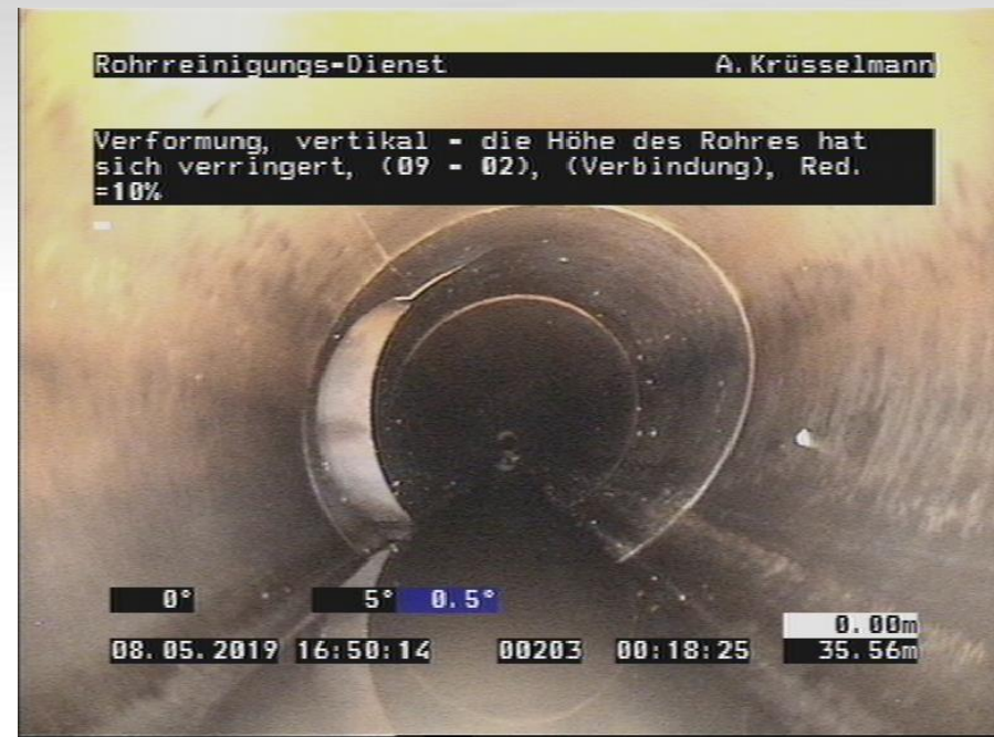
Typischer Schaden Verformung vertikal > 100 m in Summe